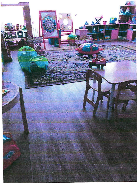
№13 зона целевого назначения здания