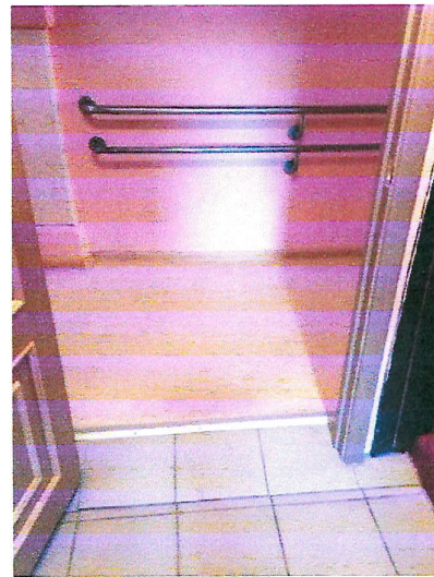
№6 вход в здание (в коридор)