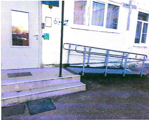
№3 главный вход в здание