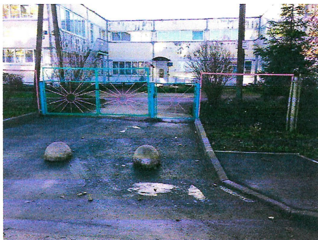
№1 Территория, прилегающая к зданию