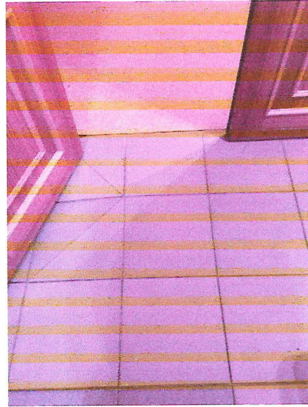
№7, №8 пути движения внутри здания