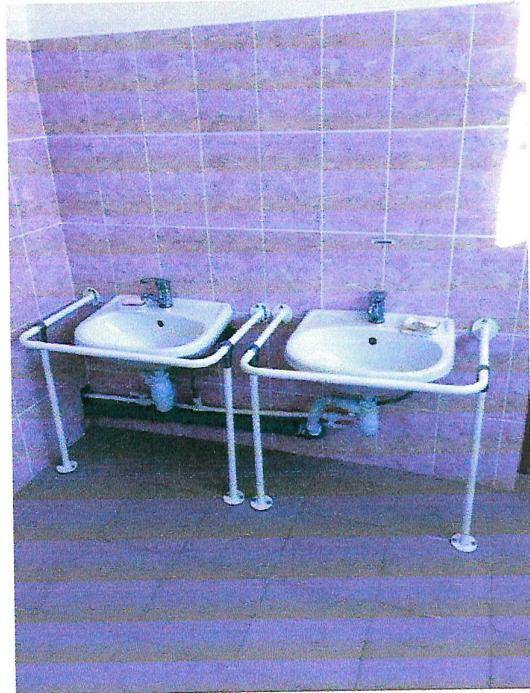
№11, №12 санитарно-гигиенические помещения