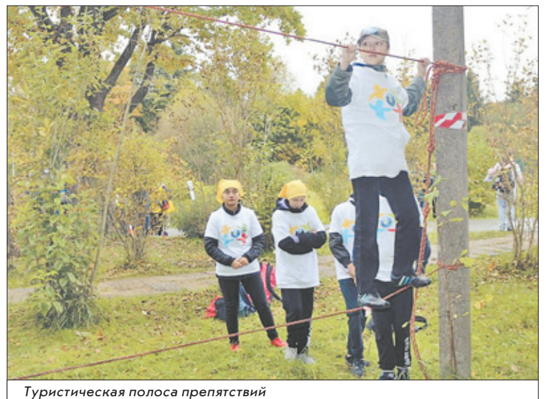
Туристическая полоса препятствий

призами, подготовленными администрацией муниципального образования Ломоносовский район: традиционным призом – мячам – рады были все: и игроки, и болельщики. А учрежденный в 2014 году переходящий почетный Кубок в этом году заслуженно достался командам Лопухинского образовательного центра!