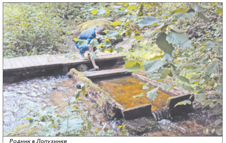
Родник в Лопухинке

Во всех пробах воды показатель жесткости (что характеризует наличие известкового осадка в воде) приближен к верхней отметки норматива. Это связано с природными факторами формирования подземного водостока и пролегающими порода-