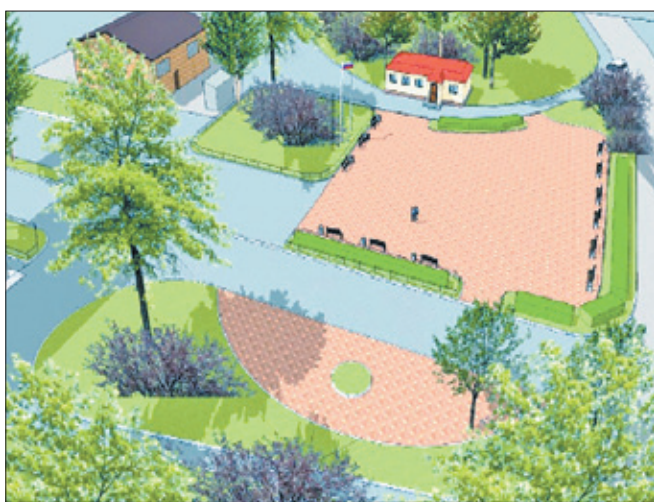
Так в проекте выглядит центральная площадь поселка Большая Ижора

Принципиально важной особенностью программы является активное участие самих жителей в обсуждении вопросов благоустройства. Кто, если не жители, лучше знают, как сделать поселок не только красивым, но и удобным для жизни? Как оборудовать места для отдыха, для парковки автомобилей, как учесть интересы торговли и населения, не забыть о детях и подростках, угодить популярным людям?