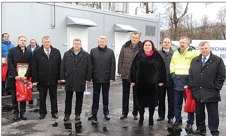
Торжественный пуск модульной котельной в Русско-Высоцком 18 декабря 2014 года.