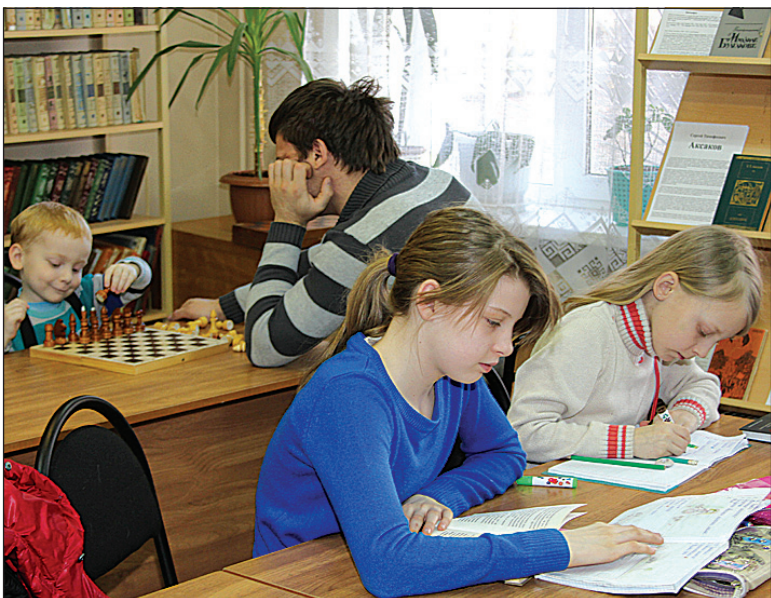
В Русско-Высоцкой сельской библиотеке и стар и млад побывать рад.