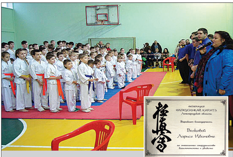
Соревнования по киокусинкай-каратэ на Кубок Главы Русско-Высоцкого сельского поселения, посвященные 72-й годовщине освобождения Ленинграда от блокады, состоялись в отремонтированном спортзале дома культуры д. Русско-Высоцкое.